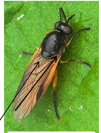
Beris vallata s.f. Beredinae

Les Beredinae, Sarginae, Clitellariinae, Stratiomyinae, Hermetiinae, Pachygasterinae