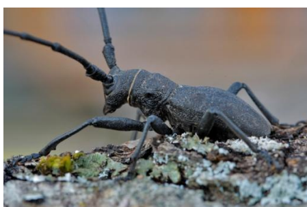
Morimus asper