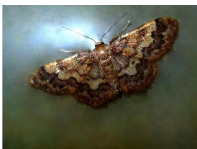
Idaea spissilimbaria