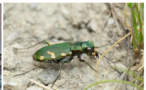
Cicindela gallica