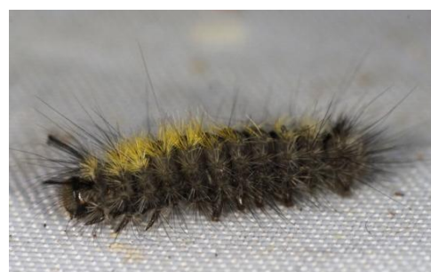
Gyanophora selenitica