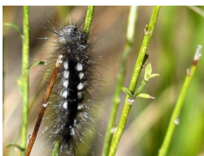
Gynaephora selenitica