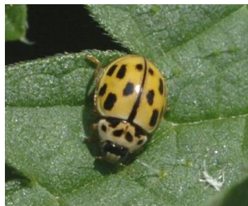
Propylea quattuordecimpunctata