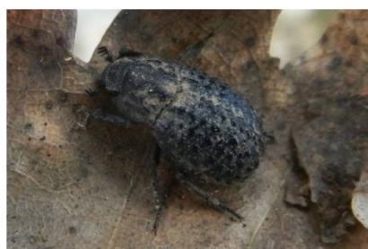
Trox perlatus