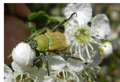
Hoplia coerulea