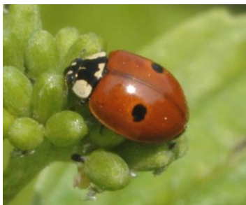
Adalia bipunctata