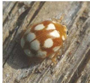
Thea vigintiduopunctata