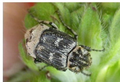
Valgus hemipterus

L'atelier porte sur les espèces de la famille des Geotrupidae , (objet du dernier exposé d'Hugo Chaintreuil). Les déterminations s'étendent à la super-famille des Scarabaeoidea comprenant entre autres les familles des Cetoniidae (Cétoines) Melolonthidae (Hannetons et Hoplies), Trogidae (Trox), Rutelinae (Hannetons colorés), Aphodiidae (Aphodius).