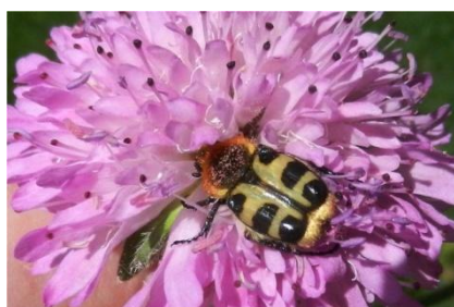
Trichius rosaceus

Très rapidement les groupes se forment autour des loupes binoculaires pour déterminer différentes espèces de Cetoniidae avec différentes Cétoines : Cetonia aurata , Netocia morio , Potosia opaca , Oxythyrea funesta , Tropinota hirta , Trichius rosaceus , T. fasciatus , etc. Un autre groupe se penche sur les Melolonthidae avec une différentiation plus délicate entre les Hoplies pour déterminer Hoplia coerulea et H. argentea . A l'issue de cet atelier, certains adhérents souhaitant approfondir le sujet, Blandine Rolland se propose de faire un exposé en février/mars.