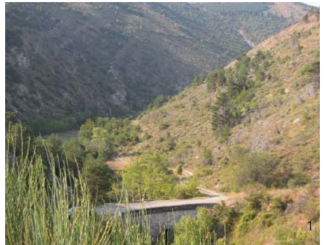
1 : Ruisseau de Luzerne, partie aval du vallon, Moydans, Hautes-Alpes, 8-IX-2012.