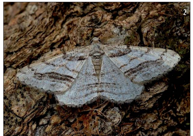
2 : C. occitanaria : Ardèche, Lagorce, 22-IX-2006. © D. DEMERGÈS.